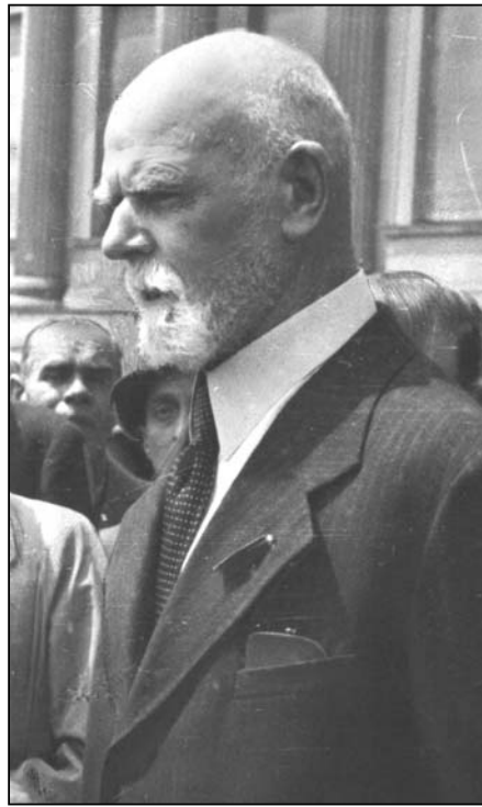
Theodor Körner (1873–1957)