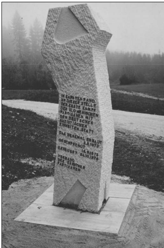
Partisanendenkmal in Robesch/Robeže

Auch hier handelt es sich um ein wiedererrichtetes Denkmal, nämlich um das erste Partisanendenkmal in Kärnten überhaupt, das 1947 am St. Ruprechter Friedhof an einem Massengrab für 83 WiderstandskämpferInnen zur Aufstellung kam. Es ist zweifelsohne auch jenes, das die größte mediale Aufmerksamkeit, auch auf gesamtösterreichischer Ebene, erreichte, zumal es nicht nur den PartisanInnen, sondern auch den Opfern der Alliierten gewidmet war. Am 10. September 1953, schon ganz im Sog um die Konflikte rund um das zweisprachige Schulwesen, wurde das Denkmal von deutschgesinnten Einheimischen gesprengt und eine originalgetreue Wiedererrichtung ließ sich die nächsten dreißig Jahre nicht durchsetzen. Zu Recht wurde von den politischen Vertretungsorganen der Kärntner SlowenInnen die Verletzung des Artikels 19 seitens der Republik kritisiert. Als der Verband der Kärntner Partisanen das Denkmal zu Beginn der 1980er Jahre in Eigenregie und ohne staatliche Beteiligung wieder aufstellen ließ – die aufbewahrten Einzelteile des gesprengten Denkmals wurden zusammengeschweißt – hatte das Denkmal seinen ursprünglichen Erinnerungsinhalt bereits verloren. Nicht mehr ‚Glanz und Glorie des Wider-