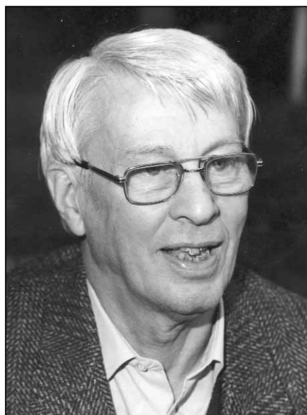
Stephan Hermlin (1915–1997)

zunehmende Entwicklung der Raketentechnik und ihrer Automatisierung vom Menschen die Entscheidung den nach starren Regeln funktionierenden Computern übertragen wird („Abschuss auf Warnung“), die andere den völligen Mangel an Erkenntnissen, wie technisch