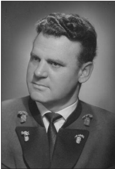
Sepp Plieseis (1913–1966)

ersten Folge der Reihe auftauchende Maya-Statue wiederfindet, den ehemaligen Wehrwirtschaftsführer stellen und verhaften. Er wird jedoch vom Fall abgezogen und schließlich vom Dienst suspendiert. Ob Härtel bestraft wird und die Pläne der Gruppe verhindert werden, bleibt offen.