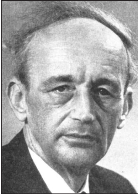
Arthur Baumgarten (1884–1966)