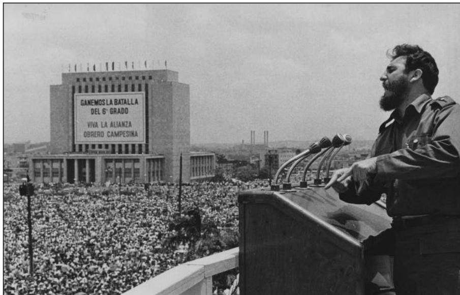
Fidel Castro am 1. Mai 1962 in Havanna

Mochte Castros Körper mehr und mehr von Beschwerden geplagt sein, der Geist des Revolutionärs bleibt hellwach. Fidel unterstützt den Kurs seines Bruders, spart aber nicht mit Kritik, wenn er das Gefühl hatte, die eine oder andere Reform schwäche die sozialistische Generallinie. 27 Viele seiner Beobachtungen erweisen sich dabei als ebenso weitsichtig wie aktuell. So registriert er den chinesischen Weg als eine Alternative zum westlichen Kapitalismus, warnt dabei aber vor zu viel Pragmatismus, 28 zudem plädiert er unermüdlich für einen breiten Zusammenschluss gegen den US-Imperialismus, der nach der Sowjetunion auch die Russische Föderation zerstören wolle, um sich endgültig die Alleinherrschaft auf dem Planeten zu sichern. 29