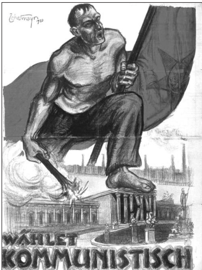
Wahlplakat der KPÖ aus dem Jahr 1920

ze. Reisecker dürfte in Linz auch Probleme mit einem Wiener Funktionär gehabt haben. Er habe die Leute bei Demonstrationen aufgepeitscht und sich dann davongemacht.